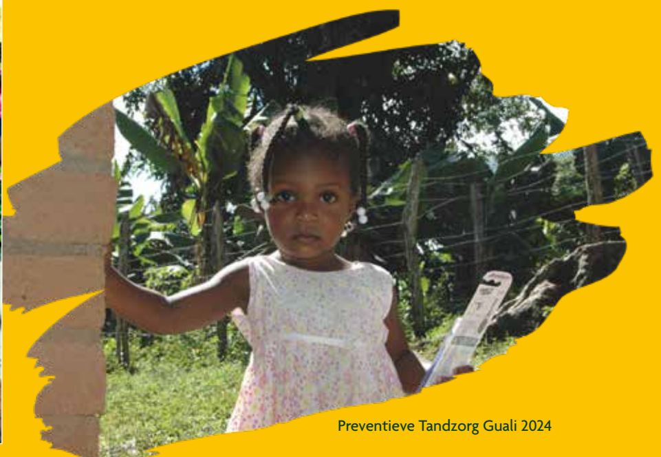
Preventieve Tandzorg Guali 2024