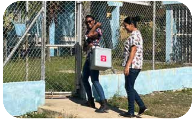
Doctora Karina en doctora Nicole brengen vaccinaties naar de gezondheidspost in Guayajayuco