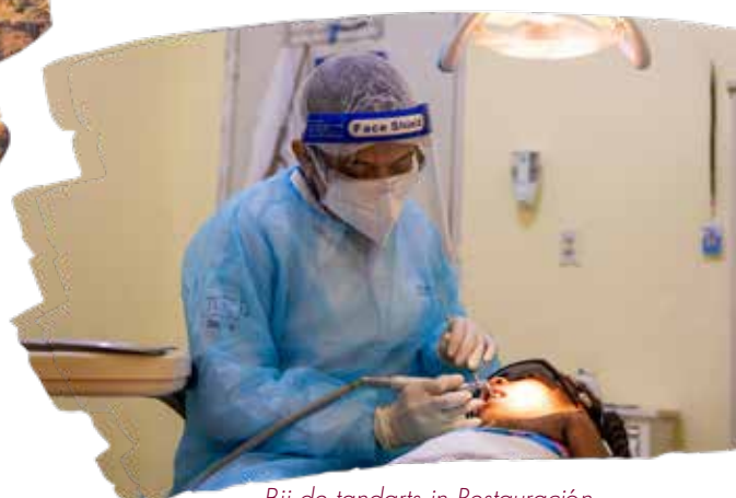
Bij de tandarts in Restauración