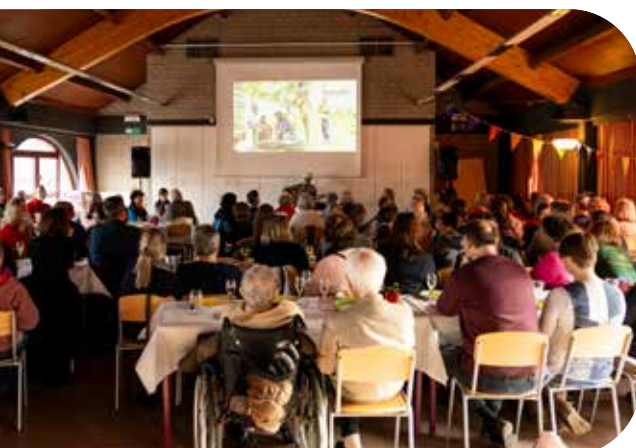
Voorstelling op Benefietbrunch Guali