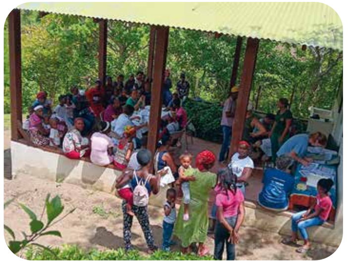
Raadpleging in Rincón