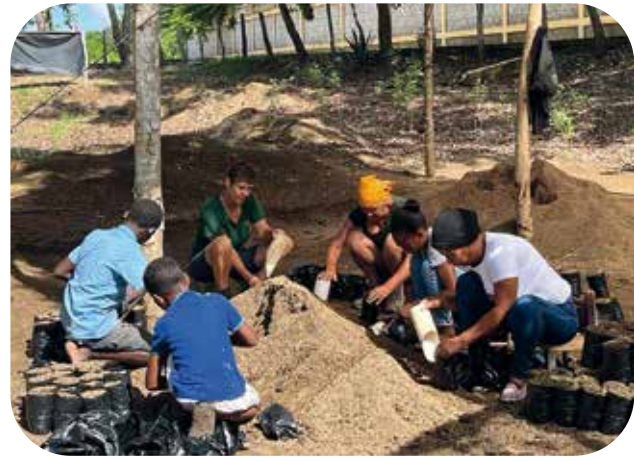
Zakjes worden gevuld met substraat voor de koffieplanten.

En toch willen we een andere groep niet links laten liggen. Het gaat over een groep armere boeren, die deze middelen niet hebben. Ze zijn zo arm dat ze niet eens de hoop hebben dat ze zelf iets kunnen doen om hun levenskwaliteit te verbeteren.