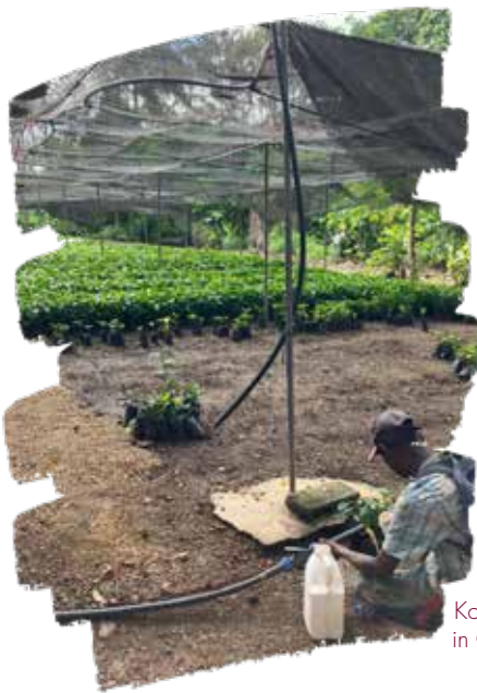
Koffieteeltplaats in Guayajayuco