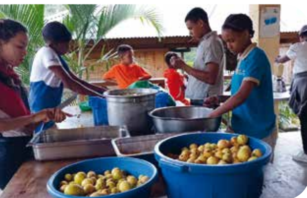
Confituur maken van Guave