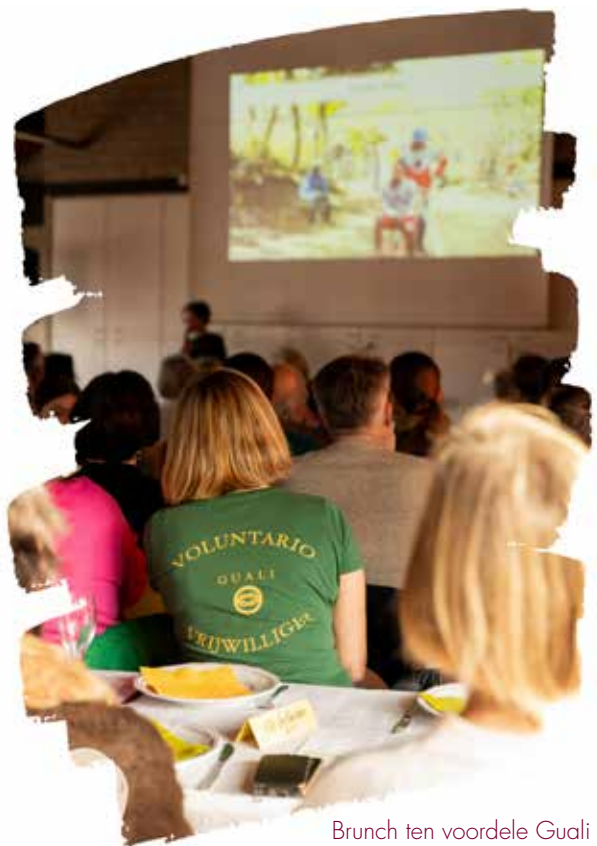
Brunch ten voordele Guali

Bijzonder geraakt worden we door de schenkingen van mensen die dit al jarenlang, soms sinds meer dan tien jaar, doen.