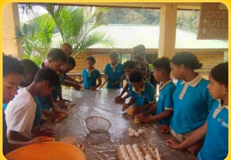
Kinderen leren koekjes bakken