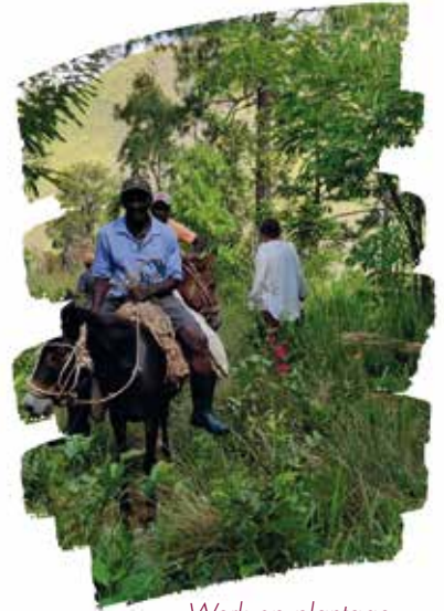
Werk op plantage

Zo kennen we weduwen die met hun kinderen op het platteland leven in heel precare omstandigheden. De landbouw is hun enige bron van inkomsten, maar ze hebben heel weinig mogelijkheden. Ze missen bijvoorbeeld de mankracht om de geschonken koffiestruikjes aan te planten. Als ze daarbij geen steun krijgen, vallen ze uit de boot. Deze meest behoeftigen mee betrekken in ons project lijkt ons belangrijk. Het is geen garantie op snel succes en spectaculaire resultaten, maar we zien het als onze missie om ook deze groep een stap vooruit te laten zetten.