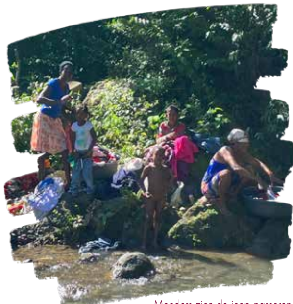
Moeders zien de jeep passeren en maken hun kinderen klaar voor de raadpleging